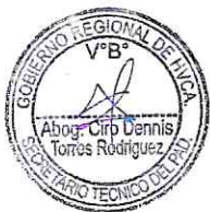
CUADRO N° 02